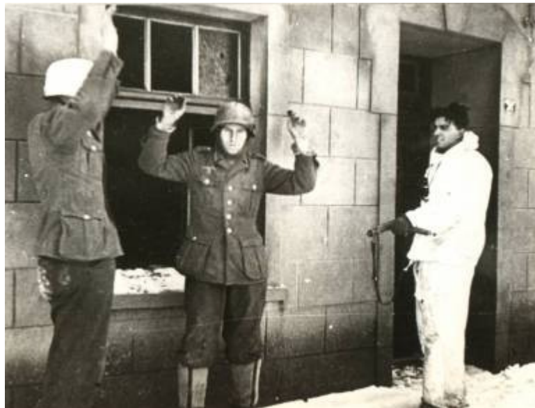
Duitse soldaten worden gevangen genomen