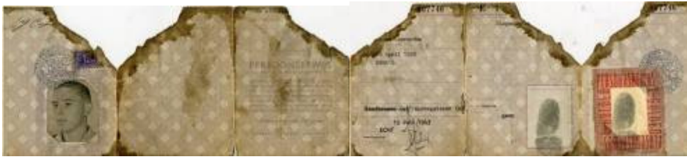
Persoonsbewijs van Jan dat in zijn borstzak zat en doorboort werd door de kogel die hem noodlottig werd