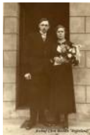
Tant Triene en Ome Thei