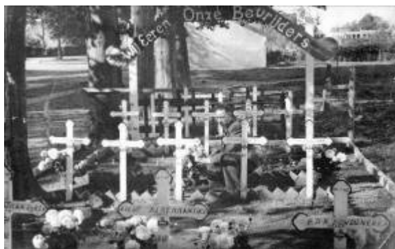
Oorlogskerkhof nabij de Kapel van Schilberg