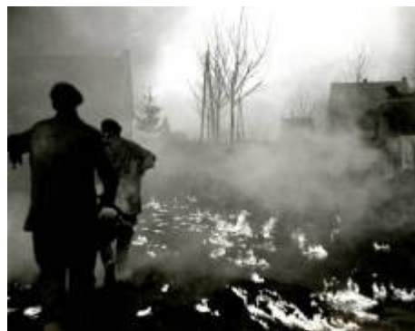
Afschuwelijke situatie op de St. Joosterweg