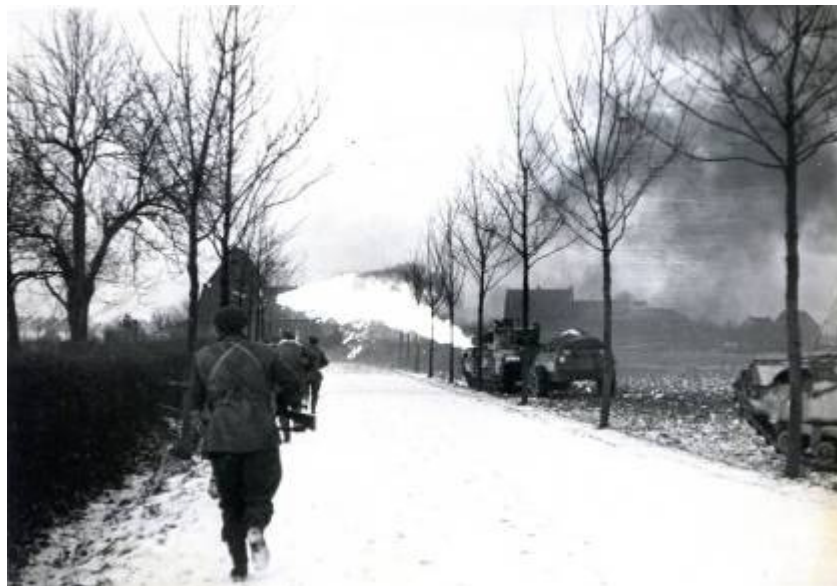
Vlammenwerper in actie op St. Joosterweg, links de contouren van het transformatorhuisje.