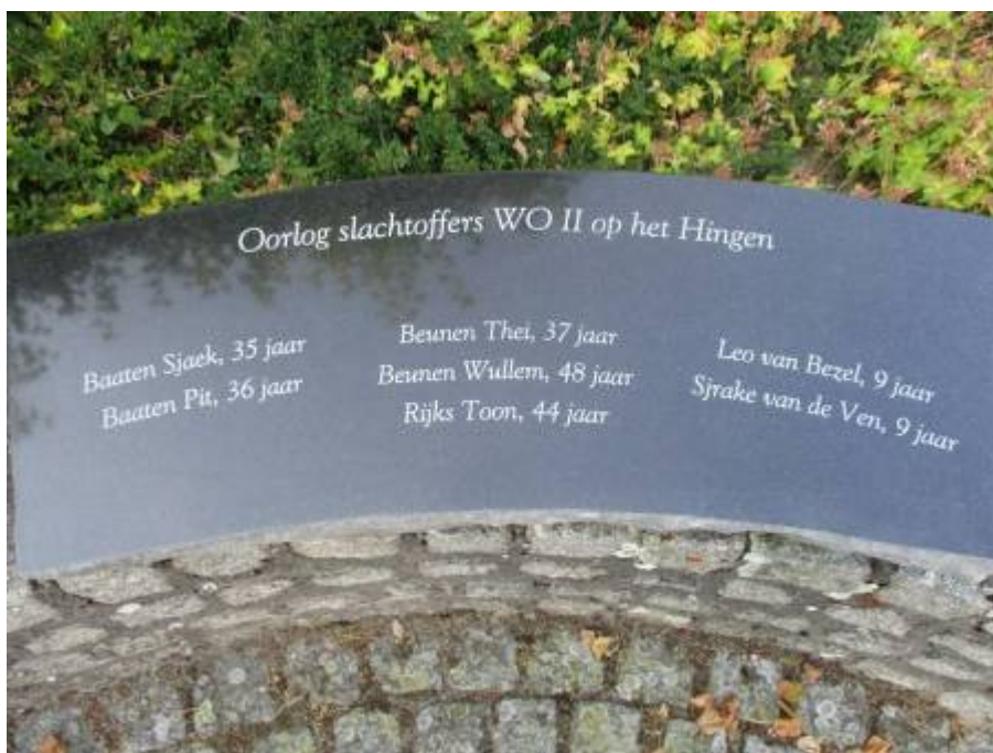
Oorlogsplaquette van de Burgerslachtoffer van het Hingen

Deze kroniek is samengesteld in het kader van de 75 jarige bevrijding, als ode en postuum eerbetoon aan de autochtone bevolking van het Hingen die tijdens de Evacuatie van 7 november 1944 tot 22 januari 1945 onderdak verschaftte aan bijna tweeduizend evacués