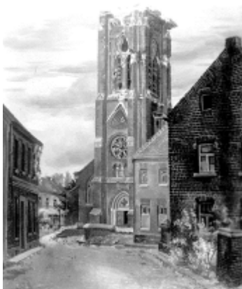
Kerk van Pey met afgeschoten toren

Omdat ons huis twee voltreffers had gehad moest er na de oorlog behoorlijk verbouwd worden en toen werden wij “Evacués” bij de familie Beunen waar we twee kamers konden bewonen. Dit ging allemaal met “Toe Beurze”