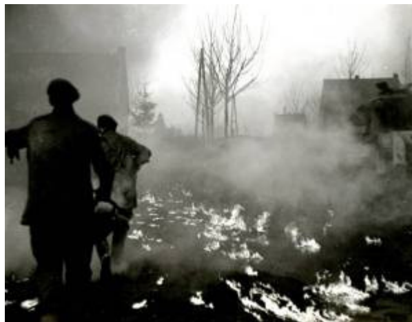
Corpus werd van het Kruisbeeld gebeden