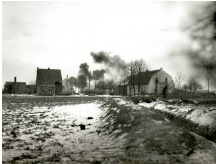
Links het huis van Giesberts en rechts van van Pol, loopgraven zijn nog goed zichtbaar