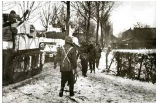
Britten met tanks en infanterie op Hingen nabij de Speeltuin