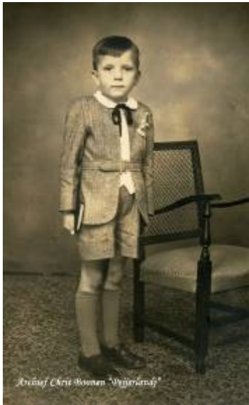
eerste H. Communie 1946

Wie d'r nóg ein jungske woar van ein joar of zès .