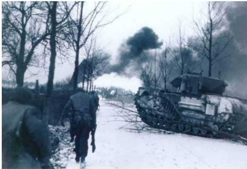
St. Joosterweg 20 januari 1945: de echte oorlog was op het Hingen

Hierna volgen de impressies van burgers die deze verschrikkingen aan den lijve hebben ondervonden.