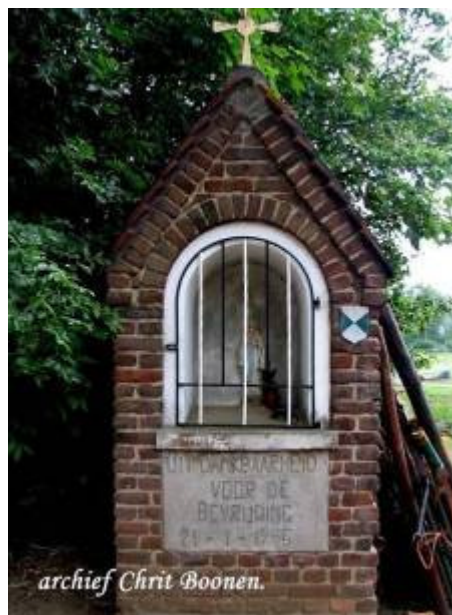
Dit kapelletje staat bij Leenderhof

“In het verleden ligt het heden en in het heden ligt de toekomst”