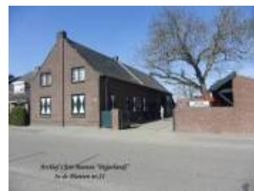
De boerderij van Beunen

Misschien zou het goed zijn om de betrokkenheid van de dorpen Hingen en St. Joost postuum nog eens extra aandacht te geven, bij de herdenking van 75 jaar bevrijding op 21/22 januari 1945.