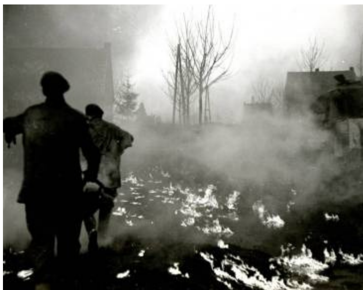
De St. Joosterweg stond in brand op 20/21 januari 1945

Ook bij haar staan de laatste verschrikkelijke dagen van de oorlog op de St. Joosterweg nu nog in het geheugen gegrift. Zij hoopt zo iets nooit meer te hoeven meemaken en ook niet de mensen die na haar komen en dat de jeugd hieruit een lering moge trekken