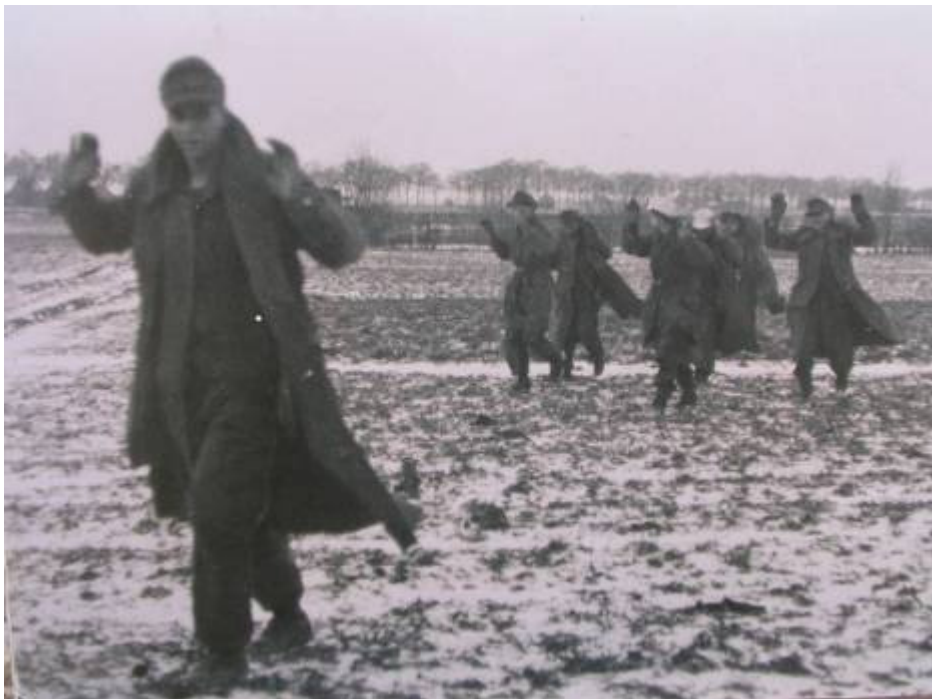
De Duitsers die zich bij van Pol overgaven, door het veld op weg naar verzamelpunt, Rijksweg Hingen Toen de dames deze foto zagen reageerden ze: "Oh dat zijn de Duitsers die mij ons lagen"

De Engelsen besloten op 20 januari 1945 om vlammenwerpers in te zetten, waardoor ook de burgers in zeer gevaarlijke toestanden dreigden terecht te komen. Graadje van Pol heeft de jonge Duitse soldaten ervan kunnen overtuigen dat er geen redding meer voor hun was en dat ze zich beter konden overgeven. Er waren ook al Engelse soldaten tot bij de schuilkelders waarin de Duitsers zaten doorgedrongen en stonden daar met mitrailleurs en handgranaten in de aanslag.