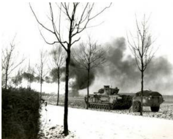
Boven de hoofden van burgers