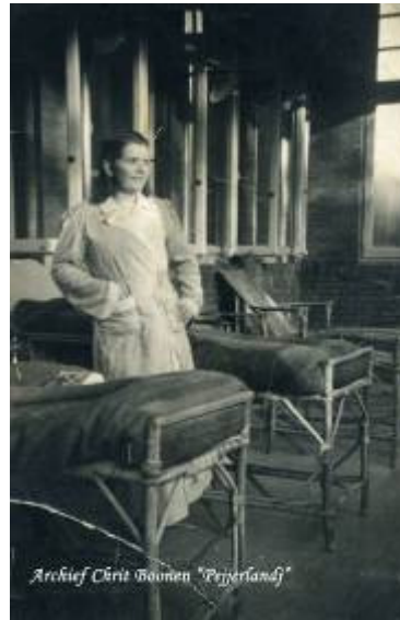
overleden op 21 jarige leeftijd in 1945

Omdat ons huis twee voltreffers had gehad moest er na de oorlog behoorlijk verbouwd worden en toen werden wij “Evacués” bij de familie Beunen waar we twee kamers konden bewonen. Dit ging allemaal met “Toe Beurze”