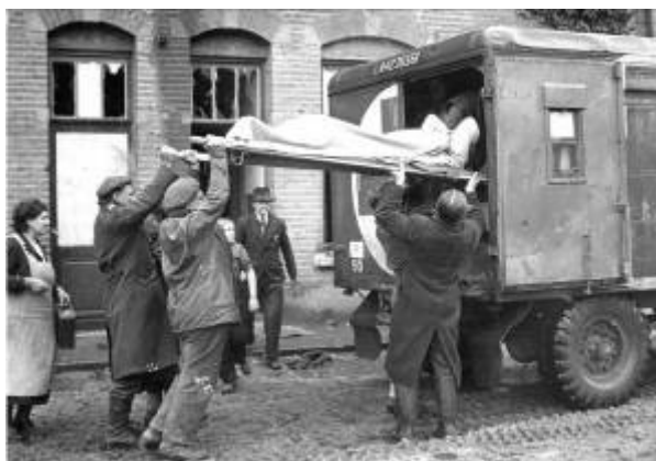
Opladen van gewonde op de Houtstraat