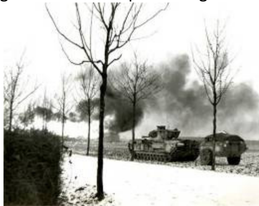
Tank op de St. Joosterweg